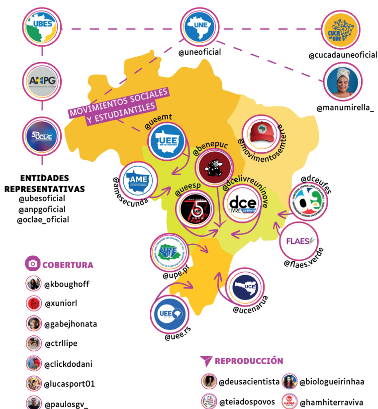
Figura 2. Mapa de la colaboración en el perfil @uneoficial.