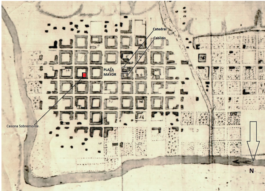
Figura 1. Ubicación de la casona Sobremonte en la traza de la ciudad de Córdoba, siglo XVIII

Fuente: Plano de la ciudad de Córdoba realizado por Manuel López, 1799. Archivo General de la Nación (AGN), sala 9, 30-6-5, interior, leg. 43, exp. 3. Recorte y edición de la autora.