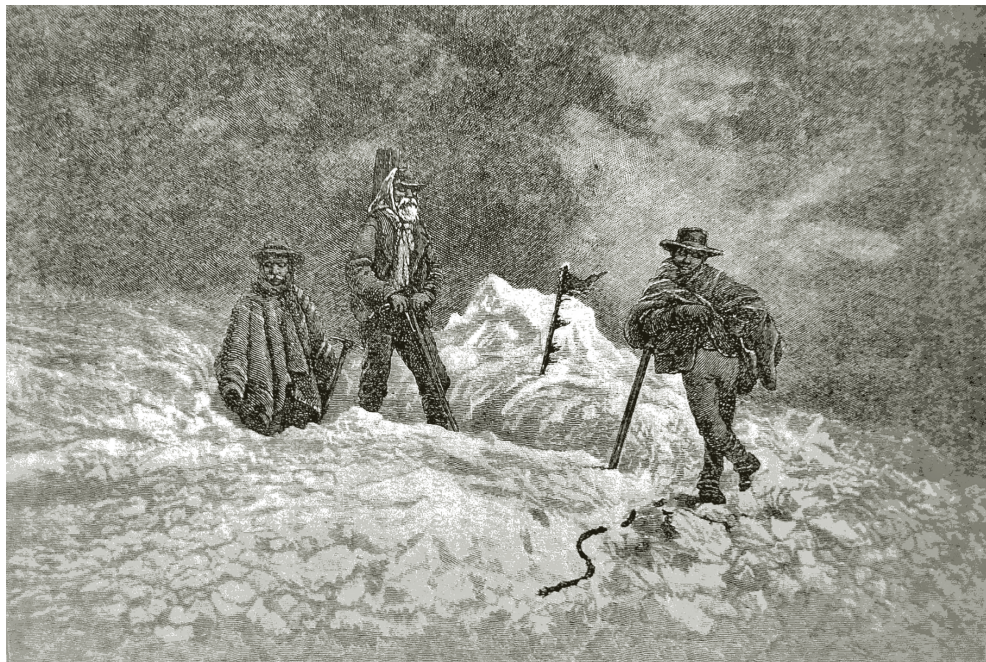
Figura 2. Grabado "The sky was dark with the clouds of ash"