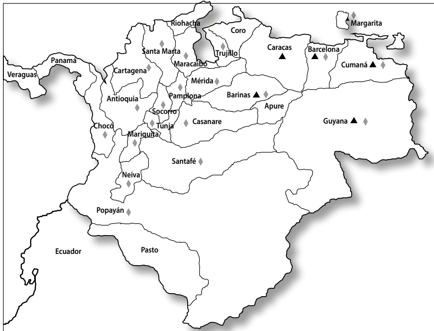
Mapa 1. Provincias que realizaron elecciones en 1818 y 1820

Fuente: Clément Thibaud, Républiques en armes. Les armées de Bolívar dans les guerres d'indépendance du Venezuela et de la Colombie (Rennes: Presses Universitaires de Rennes, 2015), 285 y ss.