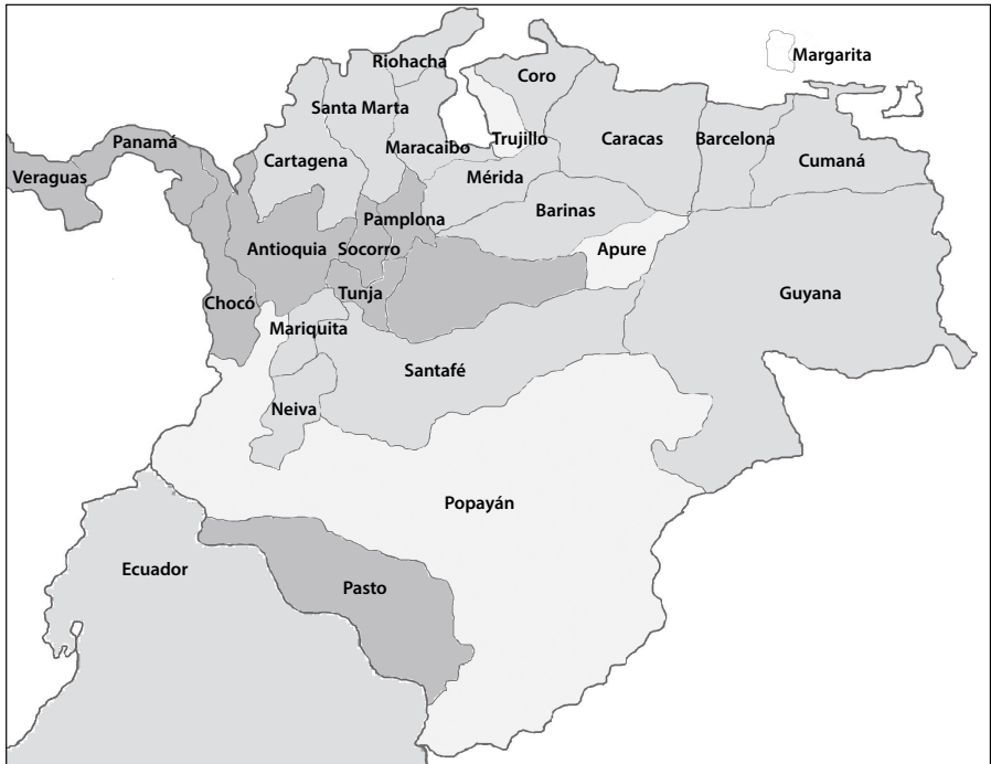
Mapa 3. Lugares en que fueron elegidos los santanderistas y los bolivarianos, 1827

Fuente: Archivo General de la Nación (AGN). Archivo Histórico Legislativo Congreso de la República. Estante 1, cara A, bandeja 3, Senado, Actas y registros de elecciones, 1826, legajo LXI.