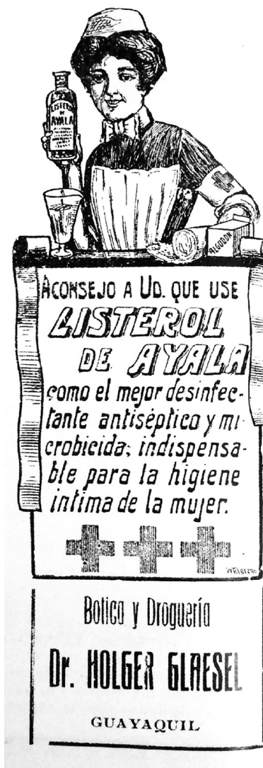
Revista Patria No. 145. Listerol de Ayala (Guayaquil, 1917). Autor: anónimo 15,7 x 5,00 cm.

Al decir de una revista parisien de actualidad, lo más chic de las fantasías ultramodernas es la que, con el nombre de moda estival, han adoptado todas las mujeres bellas deseosas de dar un golpe. Puesto que la falda corta ha perdido su prestigio volviendo a ser restaurada a sus antiguas proporciones, algo debían inventar en desquite las partidarias del exhibicionismo, ya que les está vedado perturbarnos con las líneas más o menos sugestivas y perfectas del hermoso polo austral de su aparato lo-