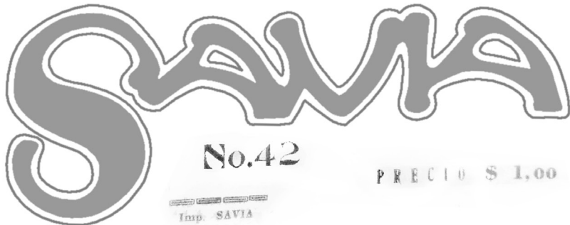
Savia No. 42. Minuto Supremo (Guayaquil, 1928). Autor: J. M. Aspiazu, 20,1 x 15,5 cm.