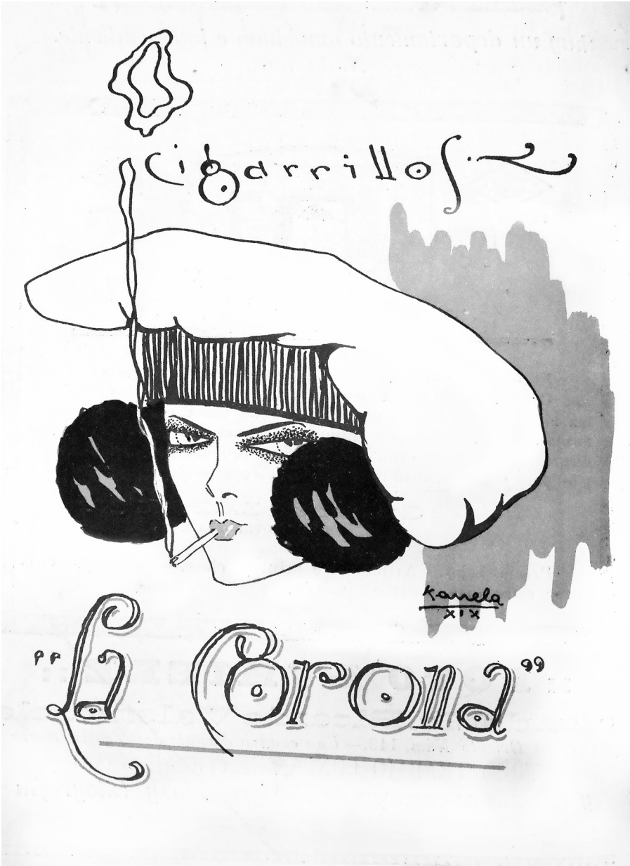
Caricatura No. 39. Serie Cigarrillos Corona (Quito, 1919). Autor: Kanela, 18 x 14 cm.