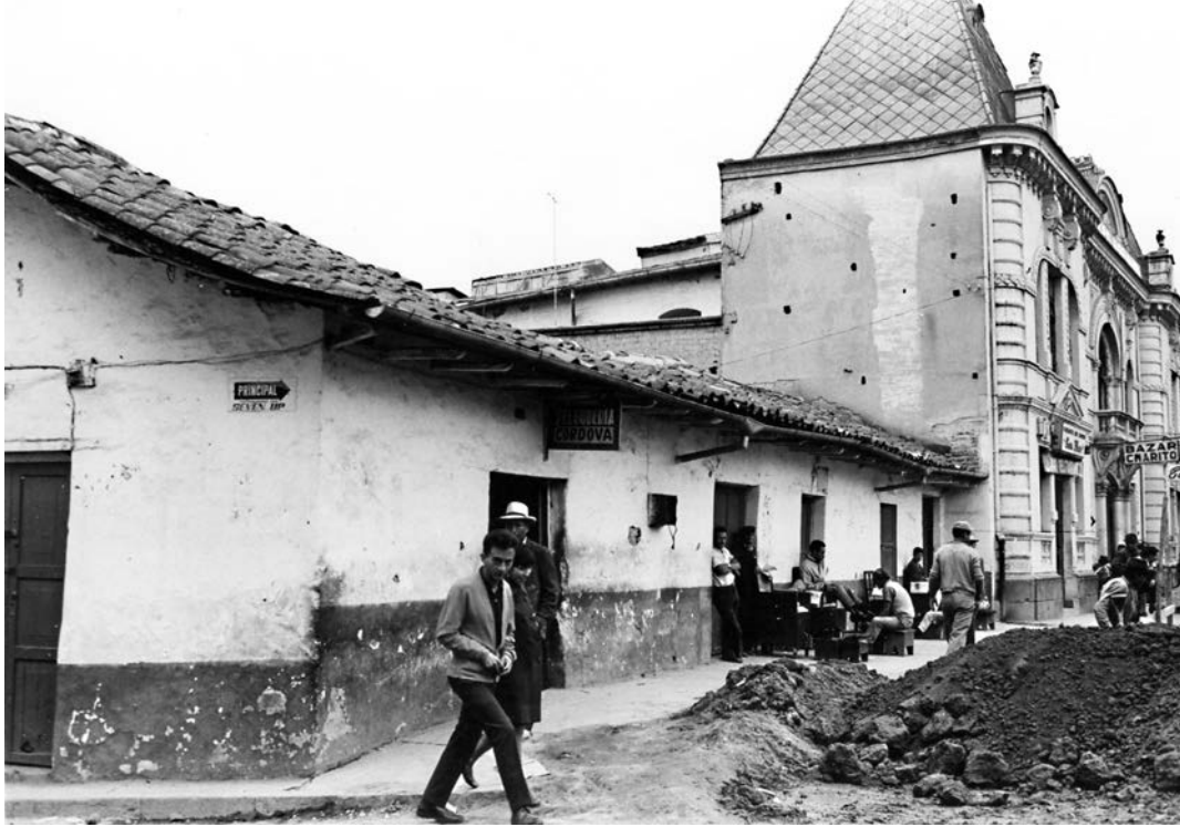
Foto 4. Biblioteca Nacional en San Blas, en 1969.

Resulta impactante la fotografía realizada por César Moreno en aquellos años, con la pared frontal del edificio en primer plano como única parte en pie entre las ruinas, como si fueran, efectivamente, los restos luego de un ataque (foto 5). Con su derrocamiento se echó abajo la inmensa importancia de contar con una Biblioteca Nacional representativa para una ciudad capital como Quito que, desde entonces, lo ha requerido.