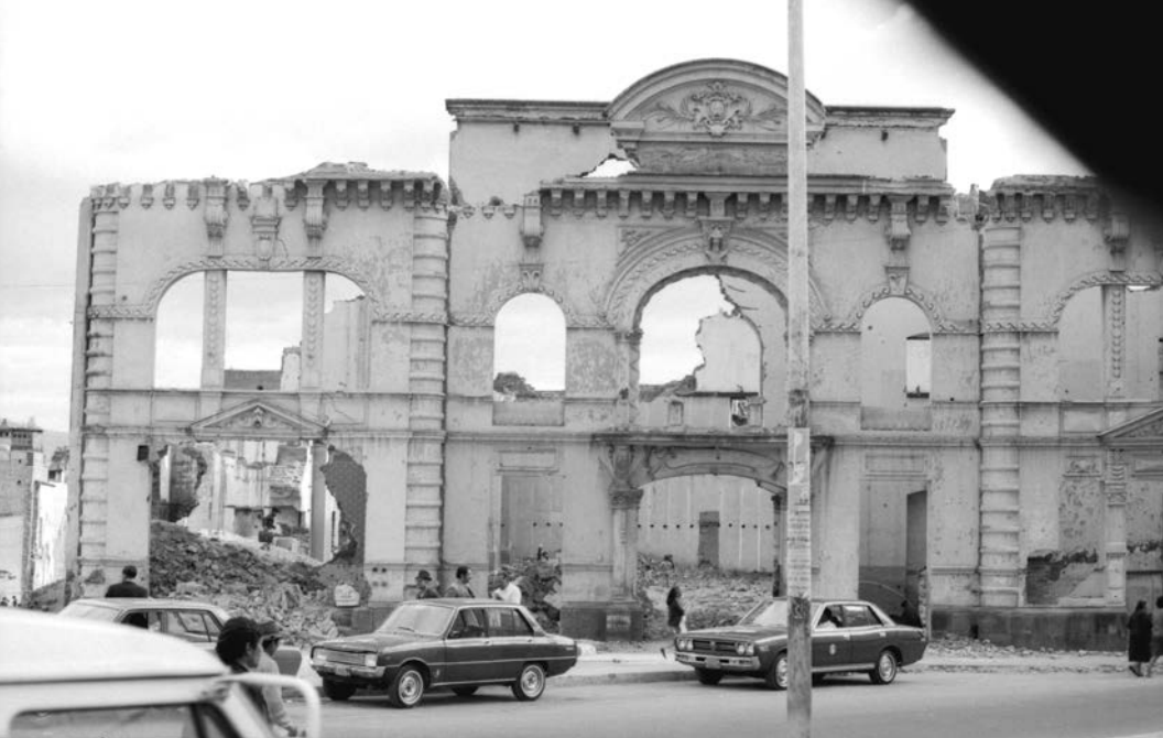
Foto 5. La Biblioteca Nacional en ruinas, aproximadamente 1974.

ró al otro lado de la plaza Bolívar, hacia la calle Gran Colombia, el edificio del banco La Filantrópica, popularmente conocido como “La Licuadora”. 65 Otras edificaciones en esta línea modernizadora son las que se levantaron en Santa Prisca; entre ellas, los edificios del Consejo Provincial, Benalcázar Mil y M. M. Jaramillo Arteaga.