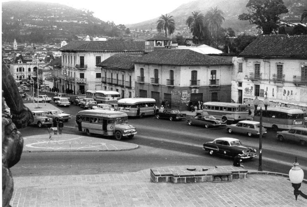
Foto 1. Sector La Alameda, calles Guayaquil y Briceño en 1964. En el fondo el edificio de la Biblioteca Nacional.

media y en forma continua hacia el norte". Se expuso por ello la siguiente alternativa: "Si tomamos en cuenta que la vía oriental tendrá vocación de tránsito pesado, el escogitamiento queda reducido a la remodelación de la calle Montúfar y a uno de los túneles". 54 De esta manera quedaba justificada la modificación de esa calle para el tránsito de transporte colectivo. Esta fue una de las medidas adoptadas con el fin de ampliar la "garganta", junto a la cual se planificó igualmente el ensanchamiento de la calle Guayaquil, entre Caldas y Briceño.