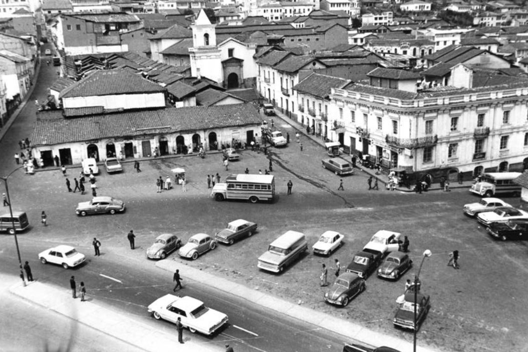
Foto 3. Plaza de San Blas, 1962. Al fondo el “mercado barato” en la Plaza España.

embargo, que las consecuencias no fueron consideradas detenidamente. Así por ejemplo, la construcción de la avenida Pichincha dividió en dos a San Blas, según Pallares, “destruyendo su concepto de plaza para convertirla en meras facilidades de tránsito vehicular”. 59 Afirmó, además, en una entrevista personal: “Podían hacer el trazado de la avenida [Pichincha] un poquito más hacia el este para salvarle a la biblioteca”. 60 Más aún, la demolición de la Biblioteca Nacional no solo significó su desaparición; este edificio, denominado Coliseum , que fue construido con cierta influencia francesa en 1921 por el arquitecto Luis Felipe Donoso, 61 era considerado “una de las más destacadas expresiones de la arquitectura de principios de siglo”. 62