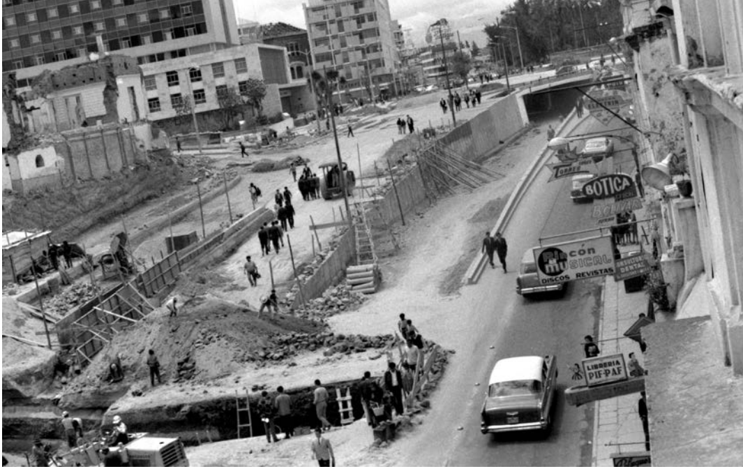
Foto 2. Nuevas vías, 1970. Construcción de un paso a desnivel entre San Blas y La Alameda.

visibilidad a la iglesia, se trasladó en 1970 el “Mercado Barato” a la plaza Arenas. 57 Estuvieron además la apertura de la calle Montúfar, así también el derrocamiento de casas para construir la avenida Pichincha con dirección a la plaza Marín y su relleno. En 1973 se inició la demolición del edificio de la Biblioteca Nacional.