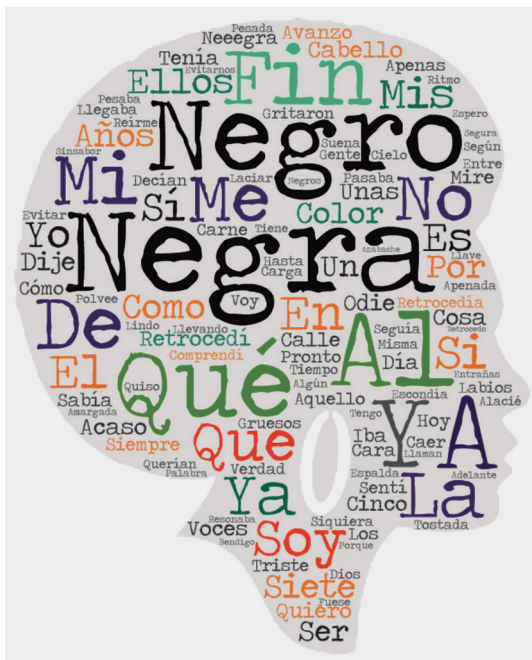
Gráfico 2. Nube de palabras

Con base al análisis de frecuencia de palabras descrito en el punto anterior y utilizando la herramienta WordArt, se presenta la siguiente nube de palabras del poema: “Me gritaron Negra”, para evidenciar de forma gráfica, la prevalencia de las palabras negra y negro ; énfasis que tiene una evidente intención artística pero también una clara intención política.