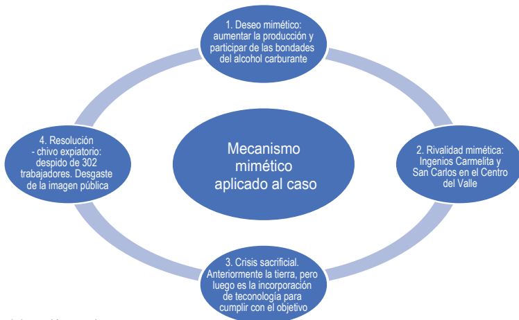
Figura 2 El mecanismo mimético en el sector azucarero estudiado